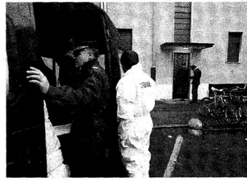
Gli investigatori davanti alla palazzina in cui è stato scoperto il corpo

Nel quartiere L'alcol e i litigi nell'appartamento dei connazionali della vittima